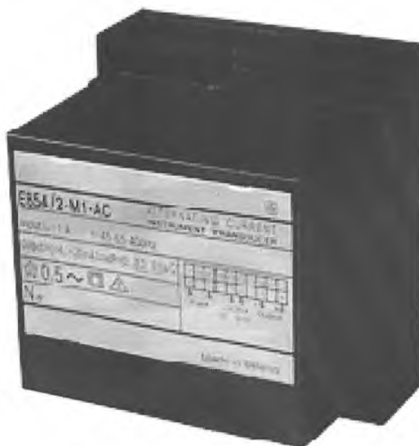
Рисунок 2 – Фотография общего вида