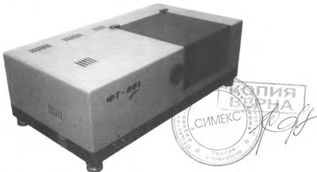
Рисунок 1 – Фурье-спектрометр ФТ-801. Внешний вид.

Персональный компьютер, к которому подключается спектрометр, осуществляет управление режимами работы спектрометра, чтение измерительной информации из буферной памяти спектрометра, ее математическую обработку и осуществляет вывод результатов измерений. Внешний вид спектрометра приведен на рисунке 1.