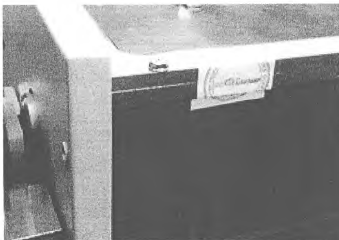
Рисунок 2 – Место пломбировки

Элементы настройки измерительной части спектрометра конструктивно защищены от несанкционированного проникновения пломбированием пломбой в виде наклейки, которая имеет печать предприятия, и при попытке несанкционированного вскрытия повреждается.