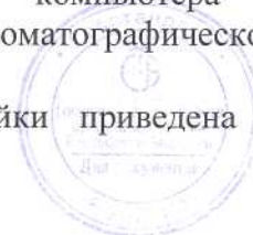
Схема с указанием места нанесения поверительного клейма-наклейки приведена в Приложении к описанию типа.

Вычислительное устройство состоит из PC/AT совместимого компьютера с предустановленным программным обеспечением для сбора и обработки хроматографической информации "АНАЛИЗАТОР".