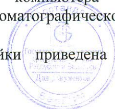
Схема с указанием места нанесения поверительного клейма-наклейки приведена в Приложении к описанию типа.

Вычислительное устройство состоит из PC/AT совместимого компьютера с предустановленным программным обеспечением для сбора и обработки хроматографической информации "АНАЛИЗАТОР".