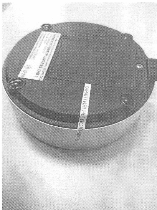
Рисунок 2. Место пломбирования термогигрометра UNITESS THB 1 от несанкционированного доступа