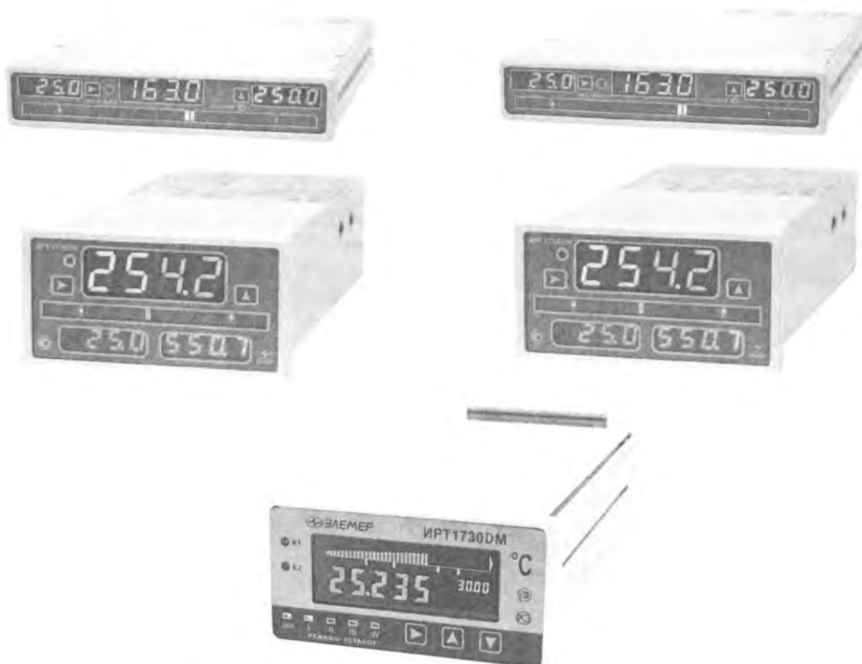
Рисунок 1 – Конструктивные исполнения измерителей-регуляторов технологических (милливольтметров универсальных) ИРТ 1730

Общий вид ИРТ 1730 представлен на рисунке 1.