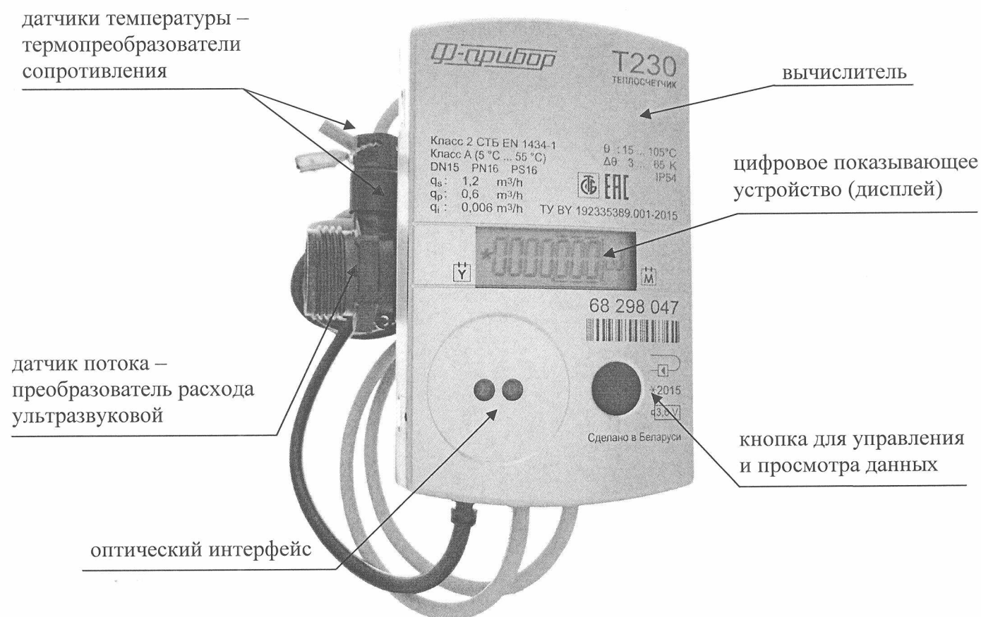
Рисунок 1 – Внешний вид теплосчетчика Ф-Прибор T230

Структурная схема условного обозначения теплосчетчиков приведена на рисунке 2.