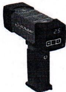
Рисунок 1 - Общий вид Кельвин Компакт

Общий вид пирометров инфракрасных КЕЛЬВИН представлен на рисунках 1 – 6. Переносные пирометры инфракрасные КЕЛЬВИН