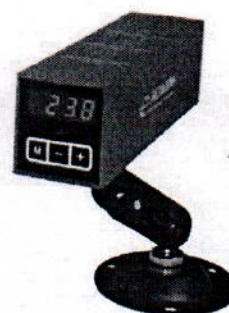
Рисунок 5 - Общий вид Кельвин Компакт с датчиком Д