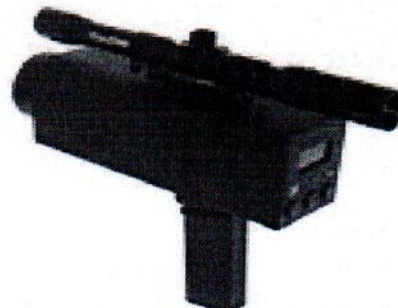
Рисунок 2 - Общий вид Кельвин ПЛЦ