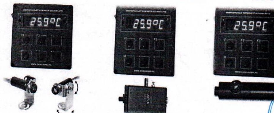
Рисунок 6 - Общий вид Кельвин АРТО