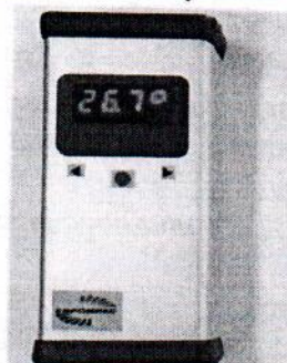
Рисунок 3 - Общий вид Кельвин 911, Кельвин Термит Стационарные пирометры инфракрасные КЕЛЬВИН