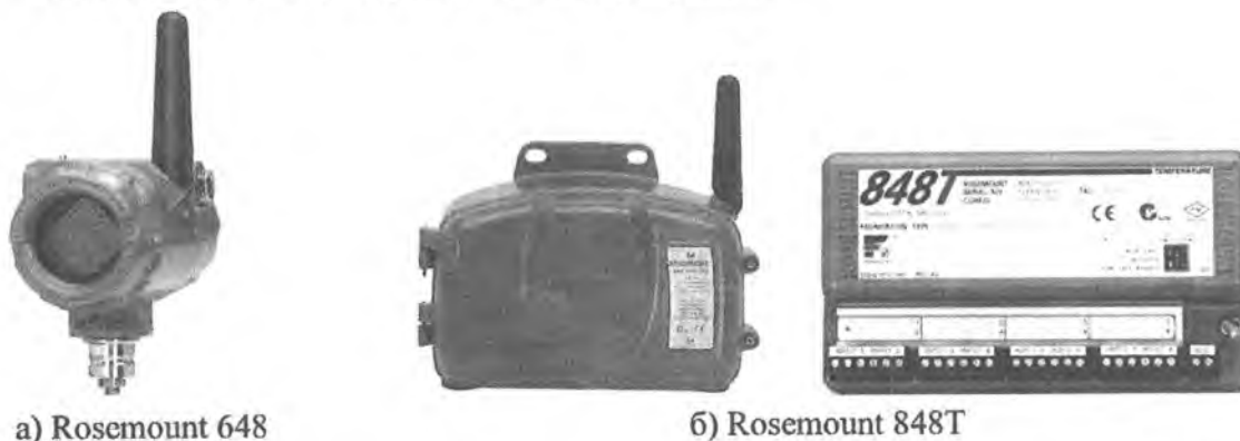
Рисунок 1 – Преобразователи измерительные Rosemount 648, Rosemount 848T

Фото общего вида ПИ представлено на рисунке 1.