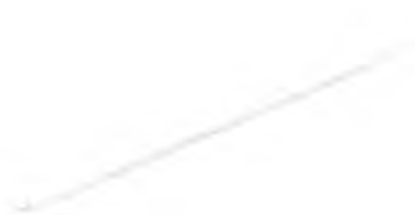
Рисунок 1 – Бескорпусные термопреобразователи

Фотографии общего вида термопреобразователей ТП-S, ТП-B представлены на рисунках 1, 2, 3.