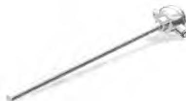
Рисунок 2 – Термопреобразователи типа ТП-S и ТП-B в металлических