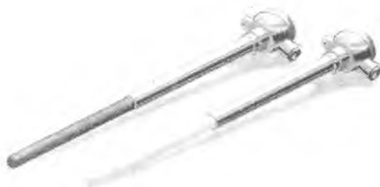
Рисунок 3 – Термопреобразователи типа ТП-S и ТП-B в керамических чехлах.