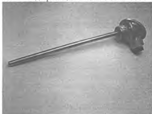
Рис.3 Модификация ТСПв/ТСМв-1088-06