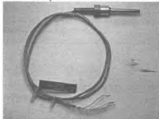
Рис.6 Модификация ТСПв/ТСМв-1288-03