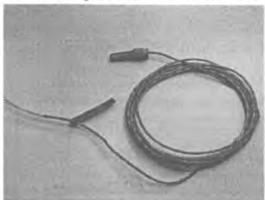
Рис.7 Модификация ТСПв/ТСМв-1388-02