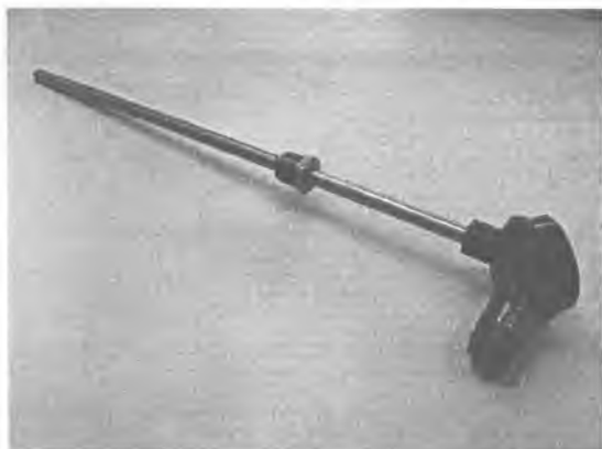
Рис.1 Модификация ТСПв/ТСМв-1088-02