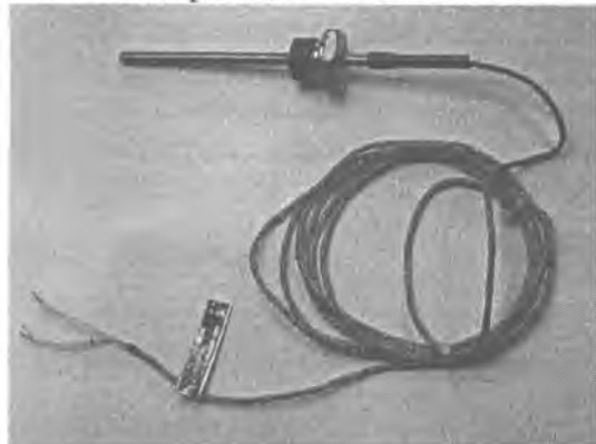
Рис.5 Модификация ТСПв/ТСМв-1288-01