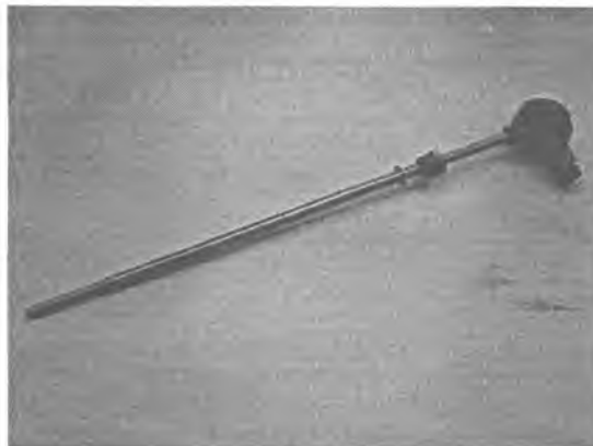
Рис.2 Модификация ТСПв/ТСМв-1088-03