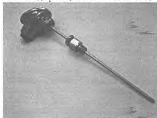
Рис.4 Модификация ТСПв/ТСМв-1288-021