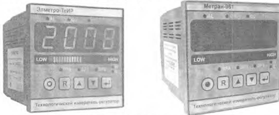
Рисунок 1 – Фотографии общего вида регулятора

Фотографии общего вида регулятора представлены на рисунке 1.