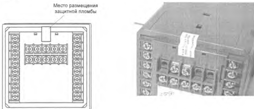
Рисунок 2 – Схема и внешний вид пломбировки регулятора от несанкционированного доступа.

Схема и внешний вид пломбировки от несанкционированного доступа представлена на рисунке 2.