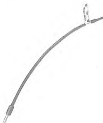
Рисунок 2 – ТСП Метран-246