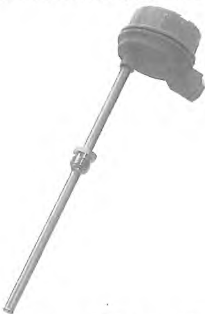
Рисунок 1 – ТСП Метран-226

Внешний вид ТС представлен на рисунке 1 и 2.