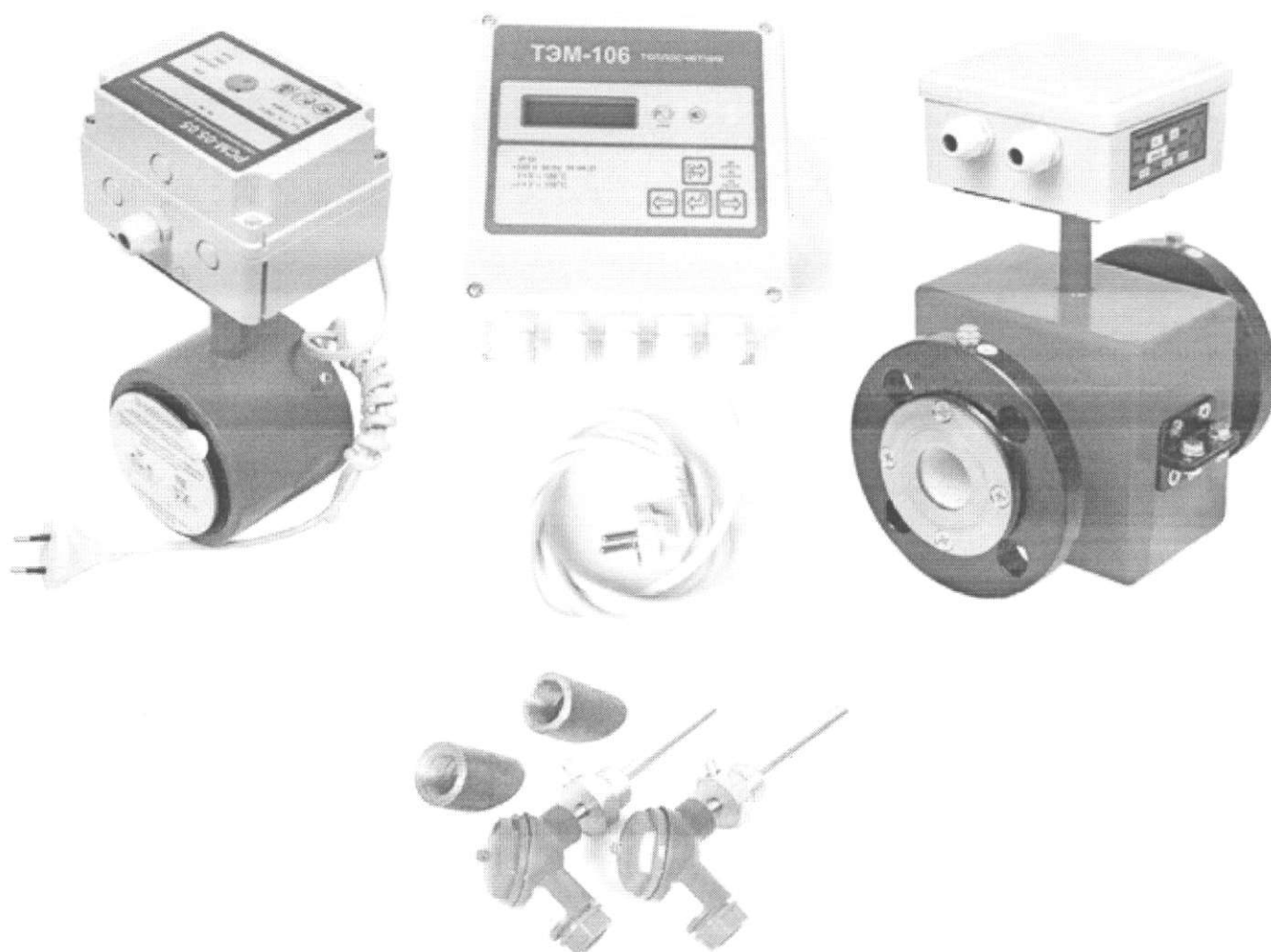
2 из 8

Оттиск клейма со знаком поверки наносится на мастику в пломбировочной чашке, установленной на креплении защитного экрана внутри корпуса ИВБ. На лицевую панель ИВБ наносится знак поверки в виде клейма – наклейка.