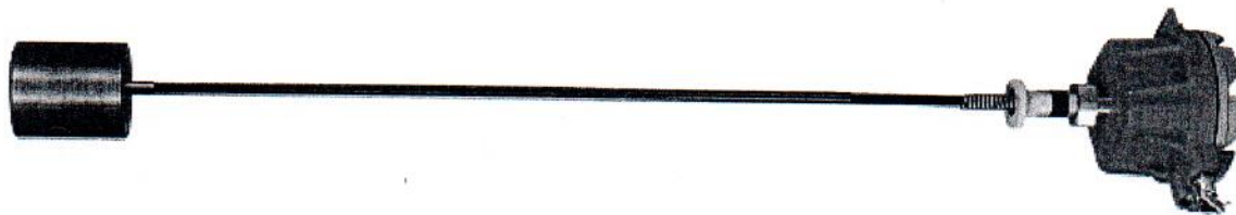
Рис.1 Фото первичного преобразователя с ЧЭ в сборе

Фотографии общего вида датчиков температуры многоточечных ДТМ2 представлены на рисунках 1-2