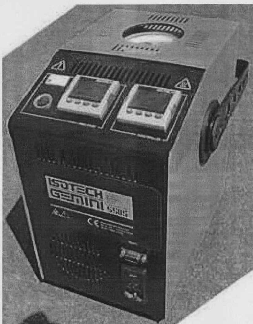
Рисунок 1 – Внешний вид калибраторов