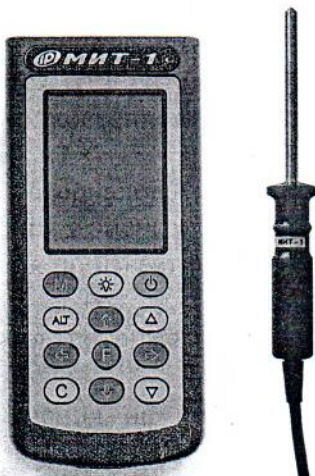
Рисунок 1 – Общий вид измерителей теплопроводности МИТ-1 (исполнение 1)

Общий вид приборов и места нанесения пломбировки от несанкционированного доступа представлены на рисунках 1-4.