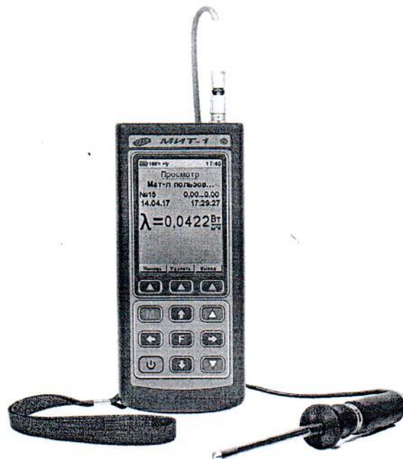
Рисунок 2 – Общий вид измерителей теплопроводности МИТ-1 (исполнение 2)