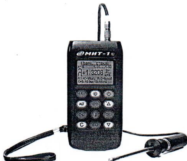
Рисунок 3 – Общий вид измерителей теплопроводности МИТ-1 (исполнение 3)