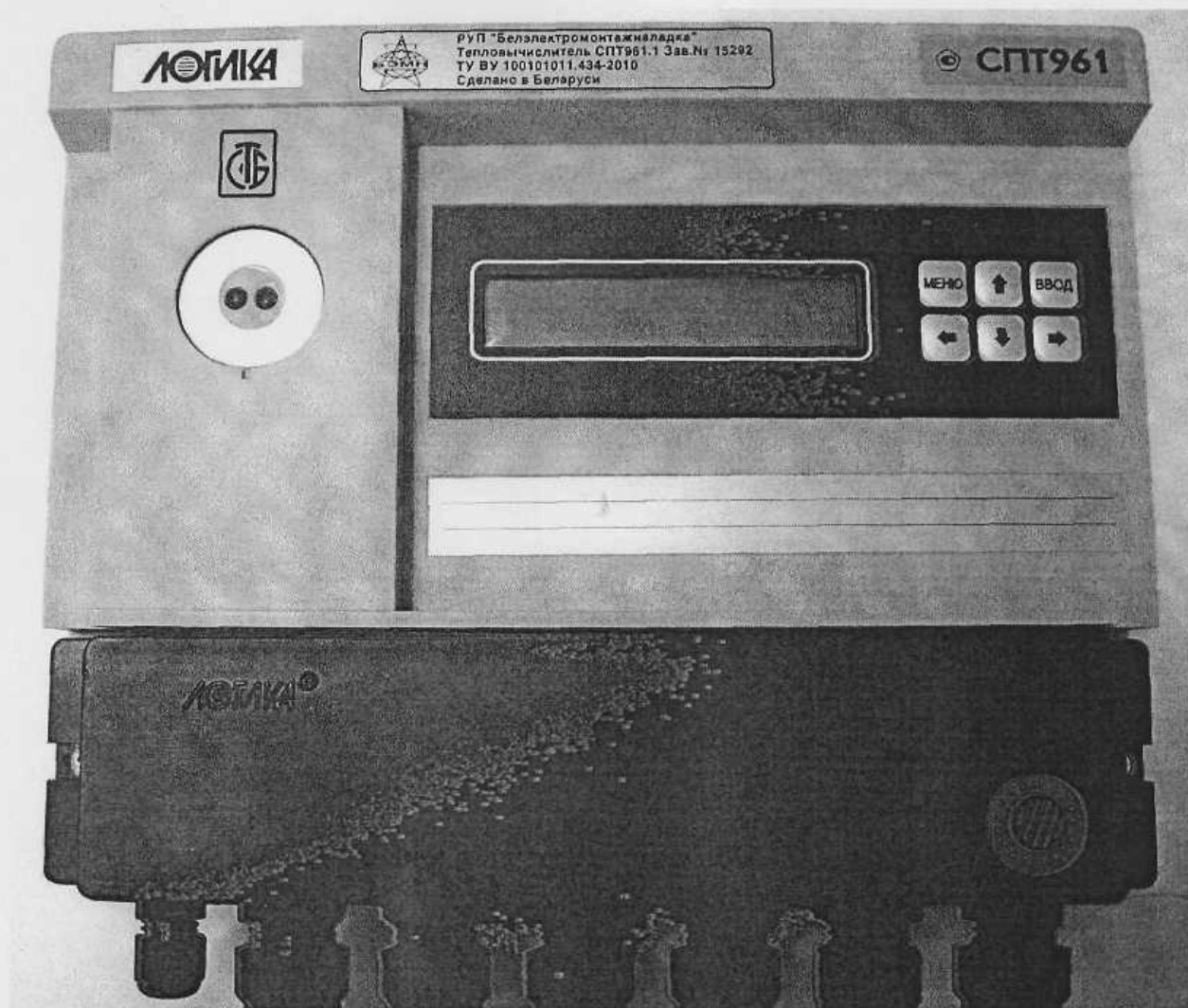
Рисунок 1 – Внешний вид тепловычислителя

Внешний вид тепловычислителя представлен на рисунке 1.