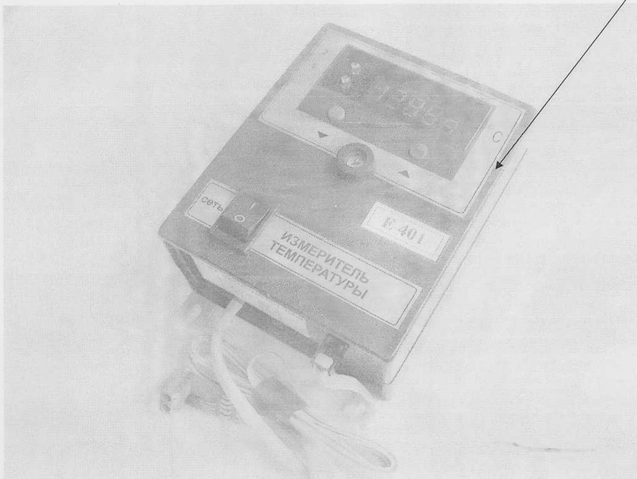
Рисунок А.1 Внешний вид измерителя температуры микропроцессорного Е401 и место нанесения знака поверки