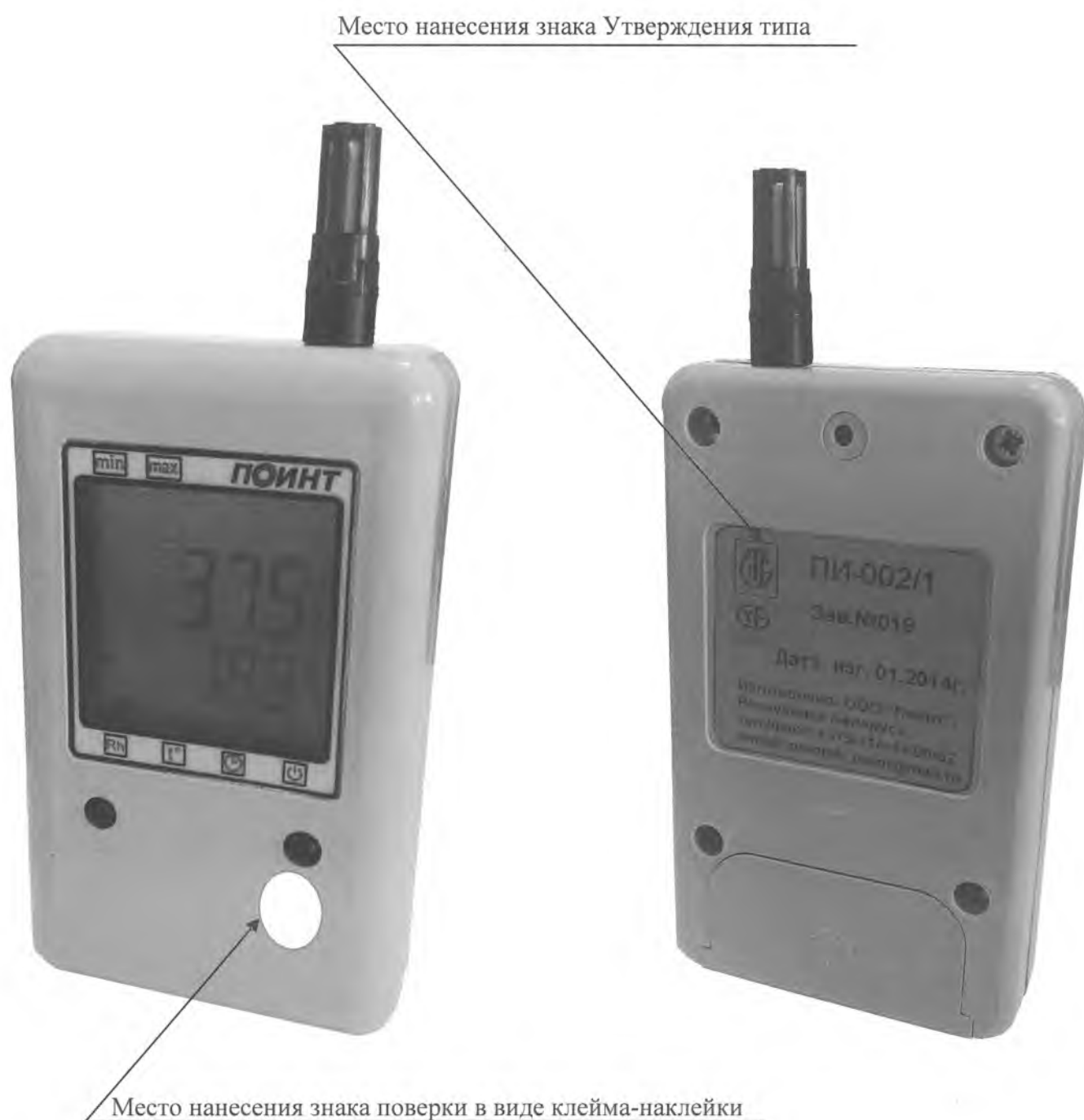
Рисунок А.1 Внешний вид прибора измерительного ПИ-002 модификации ПИ-002/1 место нанесения знака Утверждения типа и знака поверки в виде клейма-наклейки.

Внешний вид приборов измерительных ПИ-002 и место нанесения знака поверки в виде клейма-наклейки