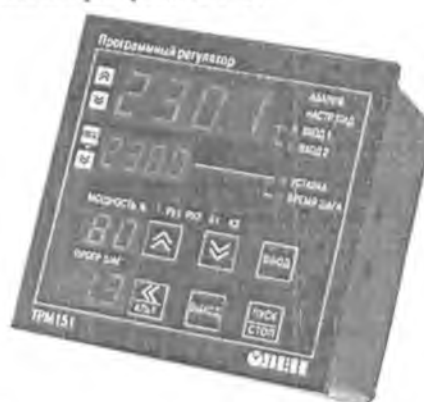
Рис.2 Общий вид приборов в корпусе Щ1