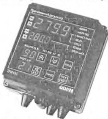
Рис.1 Общий вид приборов в корпусе Н

Фотографии общего вида приборов приведены на рисунках 1-2.