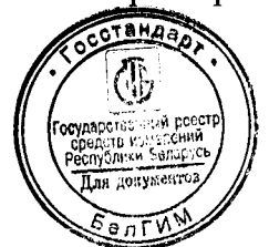
Схема пломбировки для защиты от несанкционированного доступа к элементам регулировки и места для нанесения знака поверки в виде клейма-наклейки и оттиска знака поверки приведены в приложении А.

Система защищена от несанкционированного доступа системой паролей.