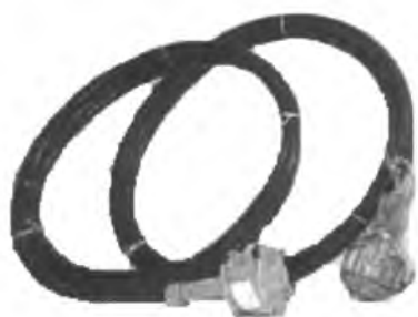
Внешний вид первичных преобразователей