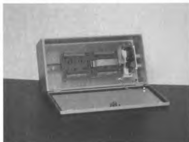
Внешний вид блока вторичных преобразователей