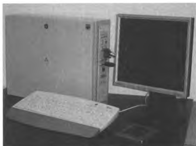
Внешний вид ПЭВМ