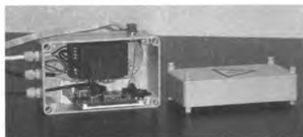
Внешний вид согласующего устройства