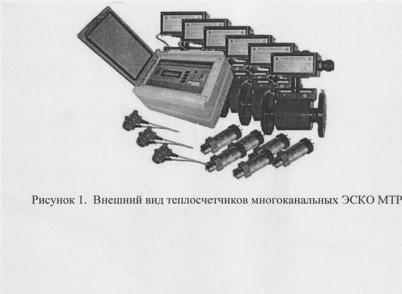
Рисунок 1. Внешний вид теплосчетчиков многоканальных ЭСКО МТР-06

Внешний вид теплосчетчиков приведен на рисунке 1.