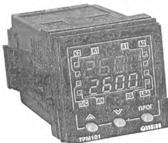
Рис.1 - Общий вид прибора

Фотография общего вида прибора приведена на рисунке 1.