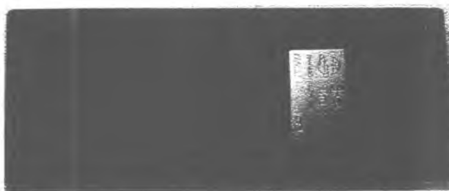
Рисунок 2 — Корпус прибора пломбируется мастичным клеймом.