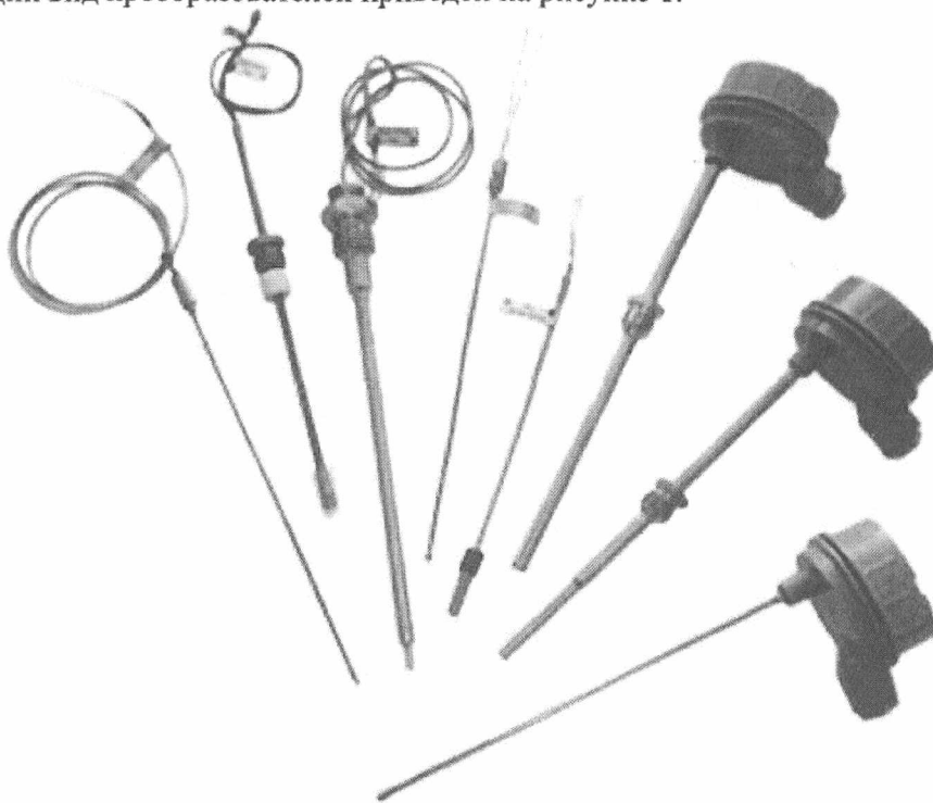
Рисунок 1 – Общий вид преобразователей ТХА Метран-200

Общий вид преобразователей приведен на рисунке 1.