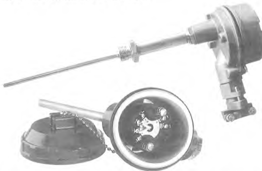
Рисунок 1 – Преобразователь температуры Метран-280, Метран-280-Ех

Внешний вид ПТ представлен на рисунке 1.