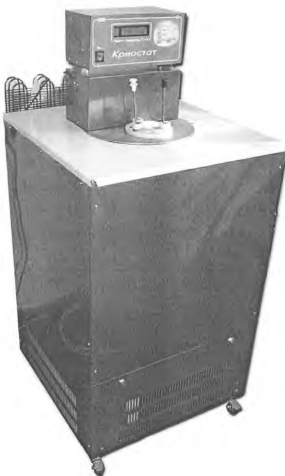
Рис. 1 Внешний вид термостата

Схема с указанием места нанесения знака поверки приведена в приложении А.