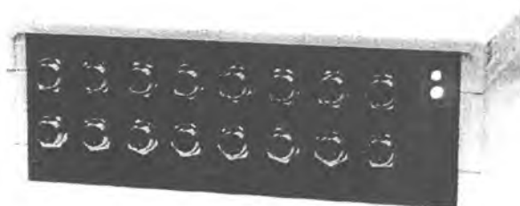
Рисунок 1 – Система поверки термопреобразователей автоматизированная АСПТ

Общий вид АСПТ представлен на рисунке 1.