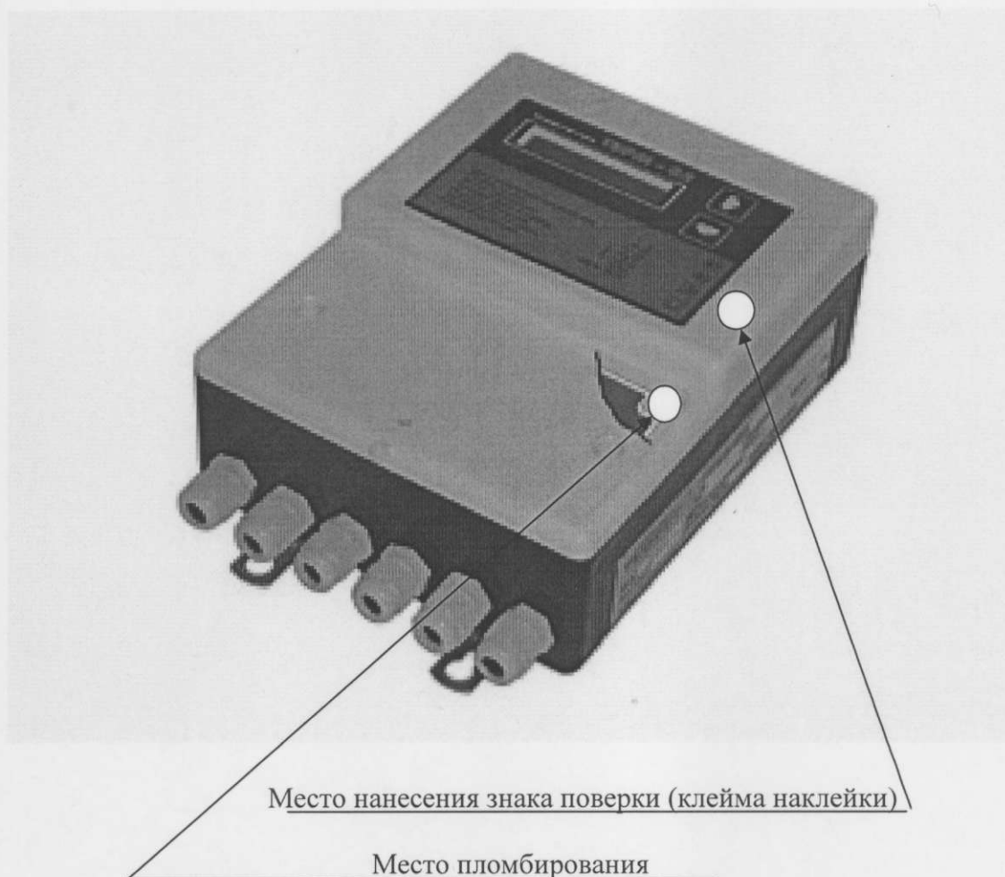
Рисунок А.1 Схема указания места пломбирования и места нанесения знака поверки (клейма наклейки)