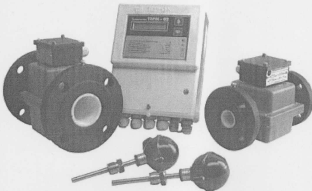
Рисунок 1 Внешний вид теплосчетчиков ТЭРМ-02