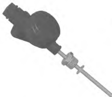
Рисунок 2. Внешний вид исполнения 2 (тип DL головка)