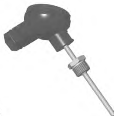
Рисунок 3. Внешний вид исполнения 3 (тип DL головка)