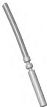
Рисунок 1. Внешний вид исполнения 1 (тип PL кабель)

Внешний вид термопреобразователя сопротивления каждого исполнения приведены на рисунке 1 – рисунке 4.