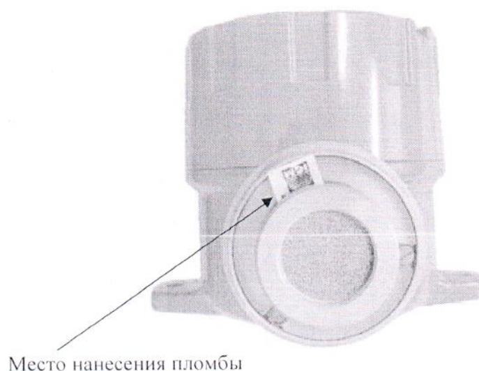
Рисунок 2 – Схема пломбировки от несанкционированного доступа