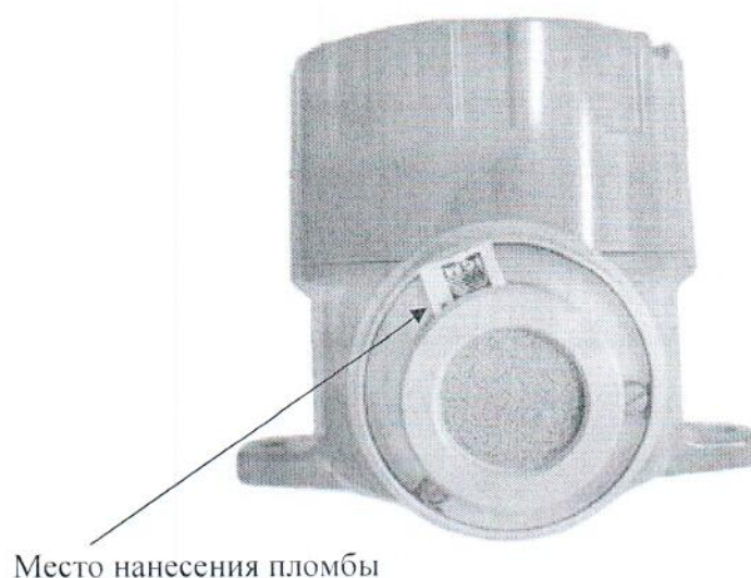
Рисунок 2 – Схема пломбировки от несанкционированного доступа