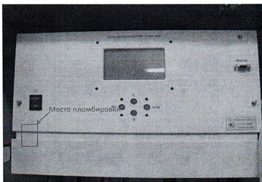
Рисунок 2 - Место пломбировки комплекса