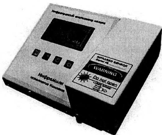
а) исполнение «Компакт»

Общий вид анализаторов молока и молочных продуктов «ИнфраМилк» представлен на рисунке 1.