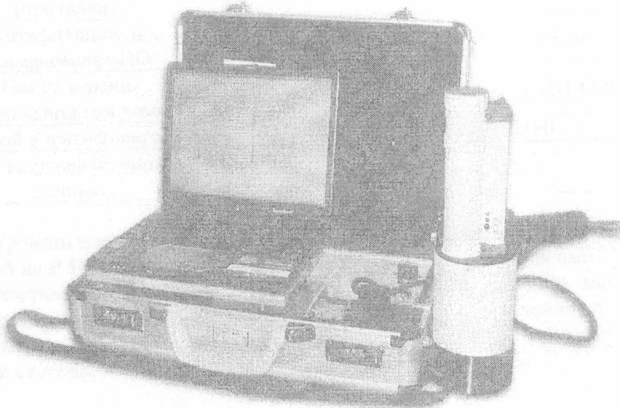
Рисунок 1 - Внешний вид анализатора «Призма - М(Au)» в переносном исполнении

Внешний вид анализатора «Призма - М(Au)» представлен на рисунках 1 и 2.