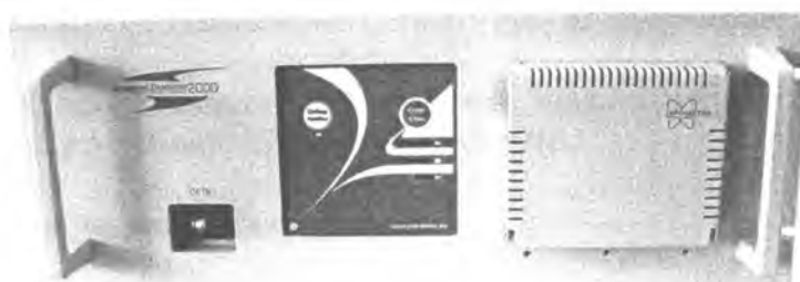
Фотография: внешний вид хроматографа исполнения 2