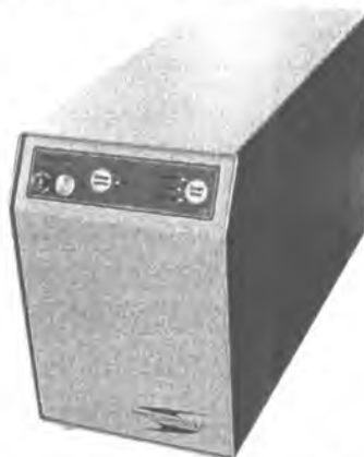
Фотография: внешний вид хроматографа исполнения 1

Хроматограф исполнения 2 отличается от исполнения 1 несущей конструкцией, т.к. предназначен для встраивания в стойку, и питанием только от сети переменного тока напряжением 220 В. Может использоваться в передвижных лабораториях, не работающих на ходу.