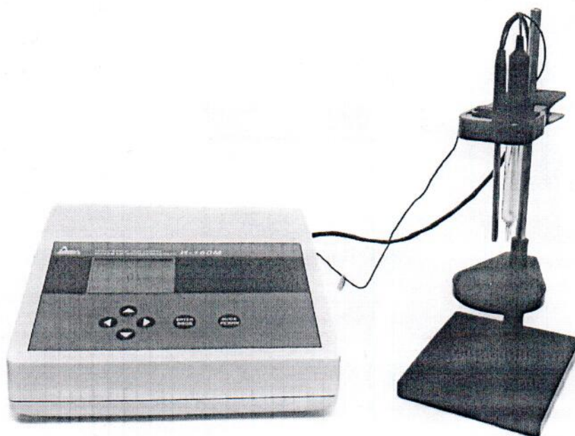
Рисунок 1 – Иономер лабораторный И-160М