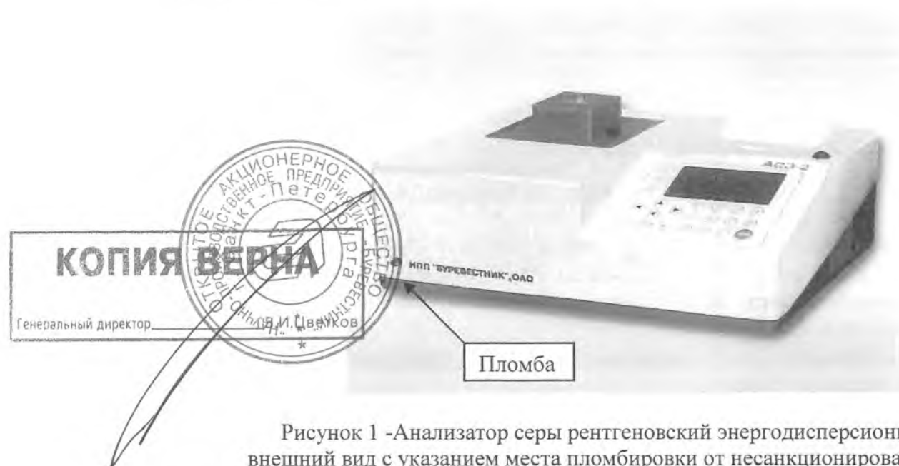
Рисунок 1 -Анализатор серы рентгеновский энергодисперсионный АСЭ-2, внешний вид с указанием места пломбировки от несанкционированного доступа.

Флуоресцентное излучение серы регистрируется газонаполненным, отпаянным, пропорциональным счетчиком, преобразуясь в нем в электрический сигнал, который затем поступает на вход предусилителя. Далее импульс напряжения усиливается регулируемым усилителем, формируется и поступает в аналого-цифровой спектрометрический преобразователь напряжение-код (АЦП). На выходе АЦП формируется цифровой код, соответствующий амплитуде импульса и определяющий номер канала, в который заносится единица, обозначающая факт регистрации импульса. Частота следования импульсов определенной амплитуды пропорциональна содержанию серы в образце. Последовательность импульсов различной амплитуды образует спектр излучения образца. Спектр обрабатывается микропроцессорным устройством и выводится на экран дисплея или принтер. Внешний вид анализатора с указанием места пломбировки от несанкционированного доступа представлен на рисунке 1.