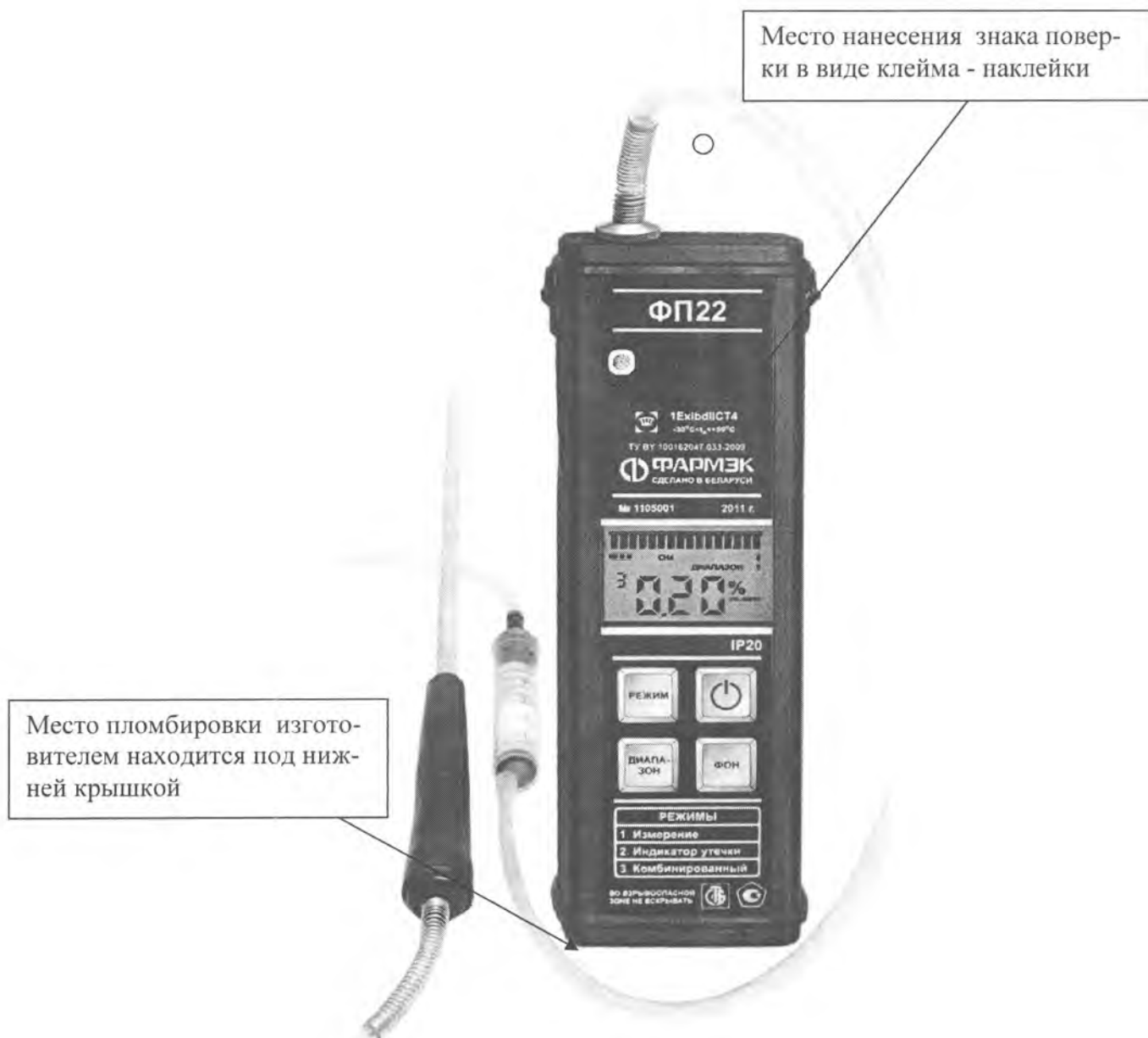
Схема пломбировки газоанализатора ФП22 для защиты от несанкционированного доступа с указанием места для нанесения знака поверки