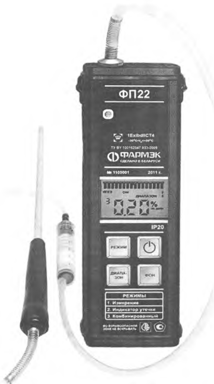
Рисунок 1 Внешний вид газоанализатора ФП22 со штангой заборной

Схема пломбировки для защиты от несанкционированного доступа и место для нанесения знака поверки в виде клейма-наклейки приведена в приложении А к Описанию типа.