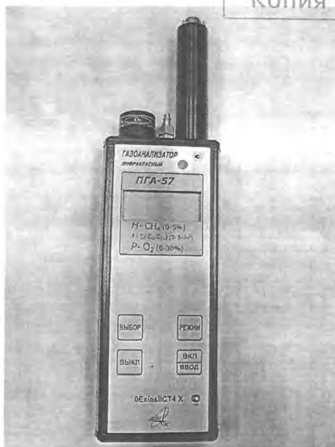
Рисунок 1 – Газоанализатор инфракрасный ПГА исполнения ПГА-57