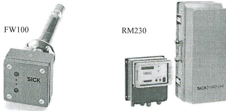
Рисунок 1. Внешний вид пылемеров FW100, FW100Ex, RM230

После гравиметрических измерений и получения калибровочных данных для всех модификаций пылемеров может выводиться измерительный сигнал, который пропорционален концентрации пыли.