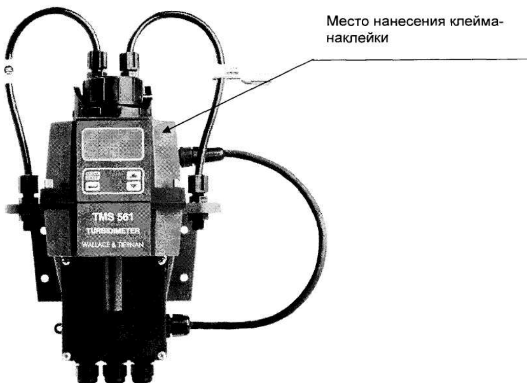
Рисунок А - Место нанесения клейма – наклейки с изображением знака поверки на анализаторы мутности TMS 561

Схема нанесения клейма-наклейки с изображением знака поверки на анализаторы мутности TMS 561