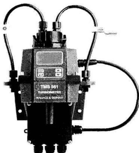
Рисунок 1- Внешний вид анализаторов мутности TMS 561