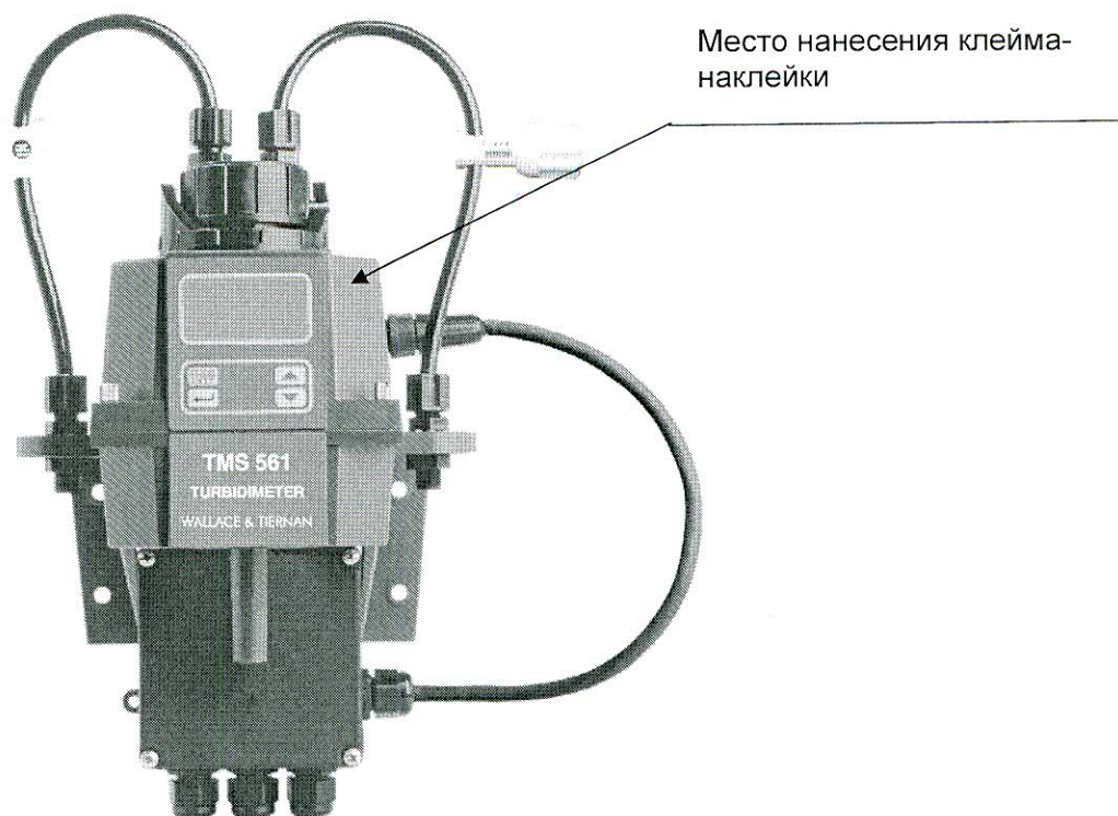
Рисунок А - Место нанесения клейма – наклейки с изображением знака поверки на анализаторы мутности TMS 561

Схема нанесения клейма-наклейки с изображением знака поверки на анализаторы мутности TMS 561