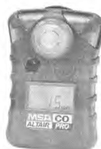
Газоанализатор ALTAIR PRO