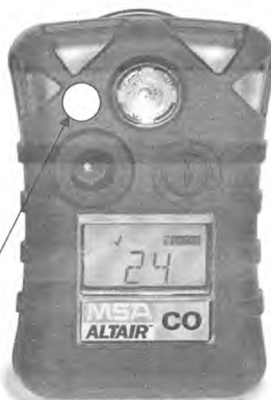
Схема с указанием места нанесения знака поверки в виде клейма-наклейки.

Место нанесения знака поверки в виде клейма-наклейки