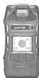
Газоанализатор ALTAIR 5X