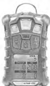
Газоанализатор ALTAIR 4X