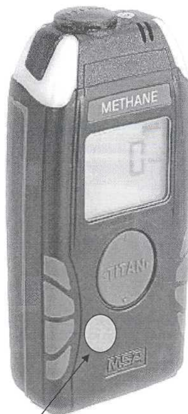
Схема с указанием места нанесения поверительного клейма-наклейки.

Место нанесения поверительного клейма-наклейки