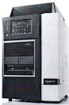
LC-2040C Nexera-i 3D