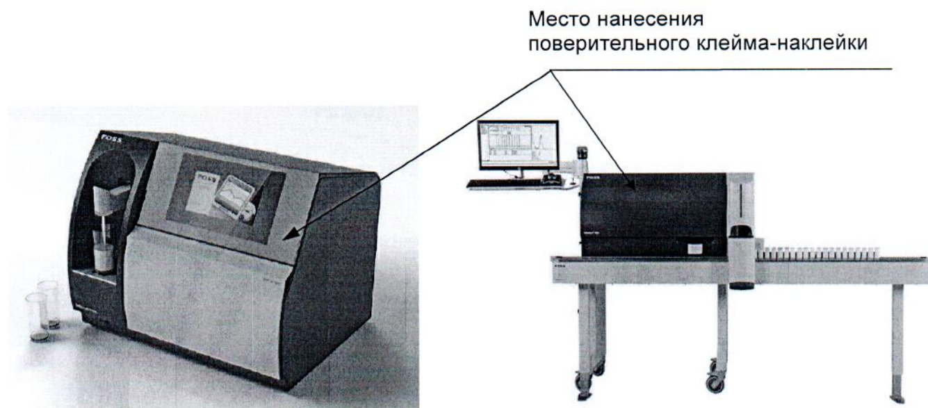
Рисунок А.1 Место нанесения поверительного клейма-наклейки на анализаторы молока серии MilkoScan