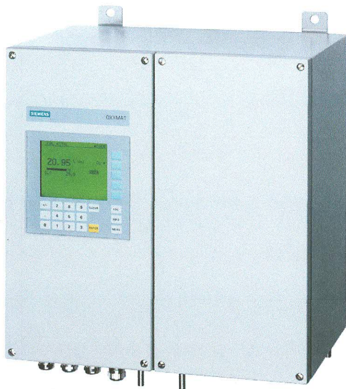
Настенное исполнение (F)

Внешний вид и варианты комплектации газоанализаторов представлены на фото 1.