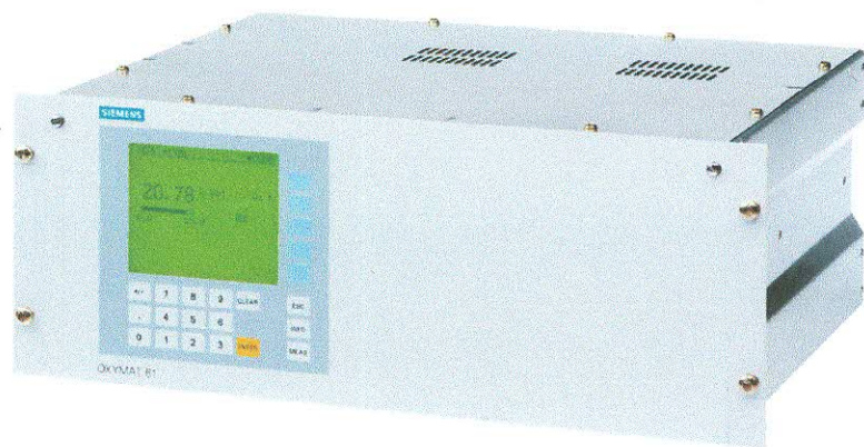
Блочное исполнение (E)